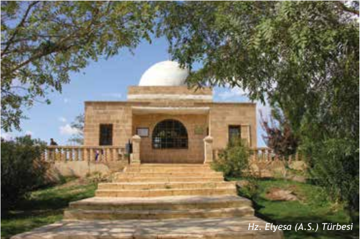
Hz. Elyesa (A.S.) Türbesi

Hz. Elyesa (a.s.) Hz. Eyyûb'un çağdaşdır. Rivayete göre; Şam diyarından göç ederek Hz. Eyyûb (a.s)'u görmeye gelen Hz. Elyesa, Eyyüpnebi Köyü'ne vardığında yoluna şeytan çıkar, yaşlı bir insan kılığında Hz. Elyesa'ya görünür ve O'na "Ey yaşlı insan boşuna yorulma Eyyûb'u bulamazsın, O buralardan göç etti çok uzaklara gitti bu yaşlı halinle O'nu bulman mümkün değil" diyerek Hz. Elyesa'yı kandırır. Hz. Elyesa artık yaşlanmıştır yürüyecek gücü kalmamıştır, hemen oracıkta Rabbine sığınarak ruhunu teslim almasını niyaz eyler. Duası kabul olur. Hz. Eyyûb (a.s.) türbesinin güneybatısında köye 500 metre kadar mesafedeki makam Hz. Elyesa (a.s.) Türbesi olarak bilinmekte ve asırlardır Hz. Elyesa makamı olarak ziyaret edilmektedir.