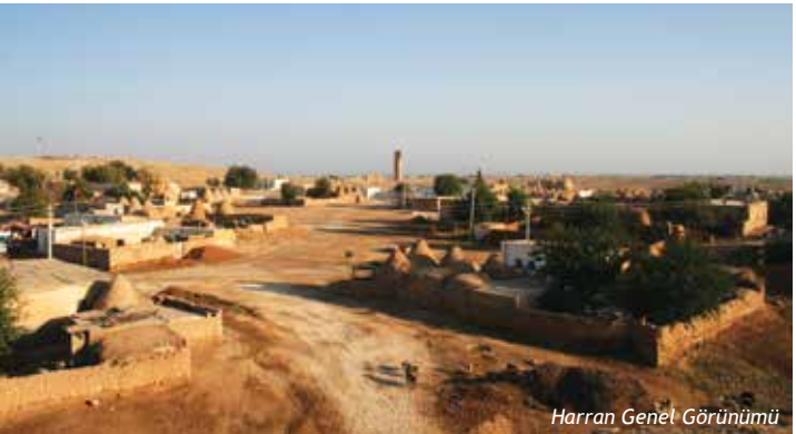
Harran Genel Görünümü

Şanlıurfa merkeze 48 km. mesafede olan ilçenin adı, etimolojik yapısı itibariyle eski uygarlıklarda “yolların kavuştuğu yer”, “kavşak” anlamına gelmektedir. Ön Asya dili olan Akatça'daki “Harranu” sözcüğüyle “Seyahat ve Kervan” anlamına gelir.