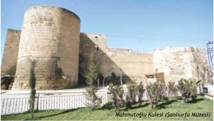
Mahmutoğlu Kulesi (Şanlıurfa Müzesi)

Beykapısı mevkiinde, Haçlı Kontluğu Dönemi'nde 19 Şubat 1122 - 18 Şubat 1123 arasında inşa edilmiştir. 2008 yılında Belediye Başkanı A. Eşref FAKIBABA döneminde kamulaştırılmış, 2011 yılında restorasyonuna başlanmıştır. Belediyemiz tarafından hazırlanan, Karacadağ Kalkınma Ajansı tarafından desteklenen "Mahmudoğlu Kulesi ve Doğu Surları Projesi" kapsamında Kule çevresindeki 24 ev ve iş yeri kamulaştırılmıştır. 2014 yılında restorasyon tamamlanmış ve yapı, Şanlıurfa Kent Müzesi olarak hizmete girmiştir.