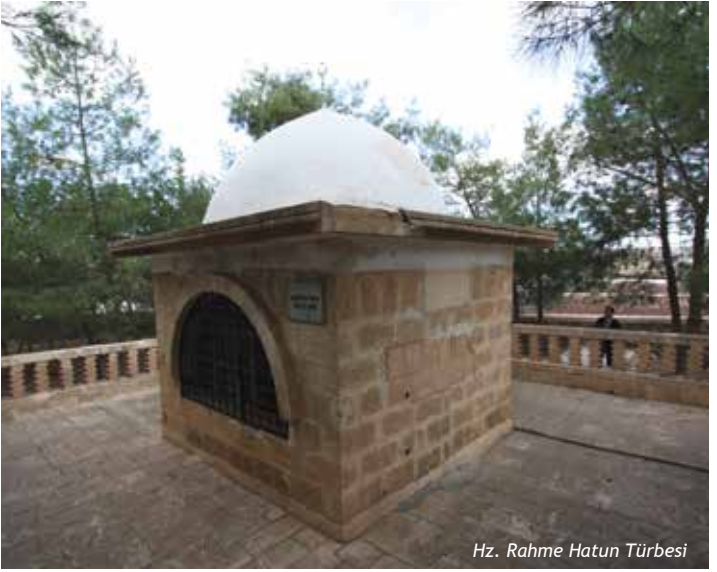
Hz. Rahme Hatun Türbesi