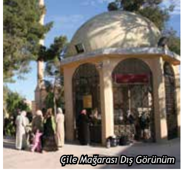
Çile Mağarası Dış Görünüm

Cenâb-ı Hakk, sevgili kulu Hz. Eyyûb'un duasını kabul eder. Topuğunu yere vurma-sını, çıkacak olan su ile yıkanmasını ve bu soğuk suyu içmesini emr eyler. Hz. Eyyûb emr-i İlâhî'yi yerine getirir ve vücudunun hem içini, hem dışını onunla temizler. Böylece hastalıklardan kurtulur. Şifalı Kuyu'nun 150 metre kadar batısındaki kalıntılarının altında kayalardan oyulmuş bir hamam olduğu, bu hamamda cüzamlı hastaların ve romatizma hastalıklarının tedavisinin yapıldığı yazılı ve sözlü kaynaklarda belirtilmektedir.