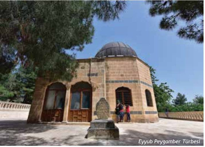
Eyyub Peygamber Türbesi

sahibi olmuştur. İmtihan öncesi sahip olduğu zenginliğe fazlasıyla sahip olmuştur. Hz. Eyyûb (a.s.)'un 93, bir başka görüşe göre 164 yaşında vefat ettiği rivayet edilir. Hz. Eyyûb (a.s.) Eyyüpnebi Beldesi'ne defnedilmiştir.