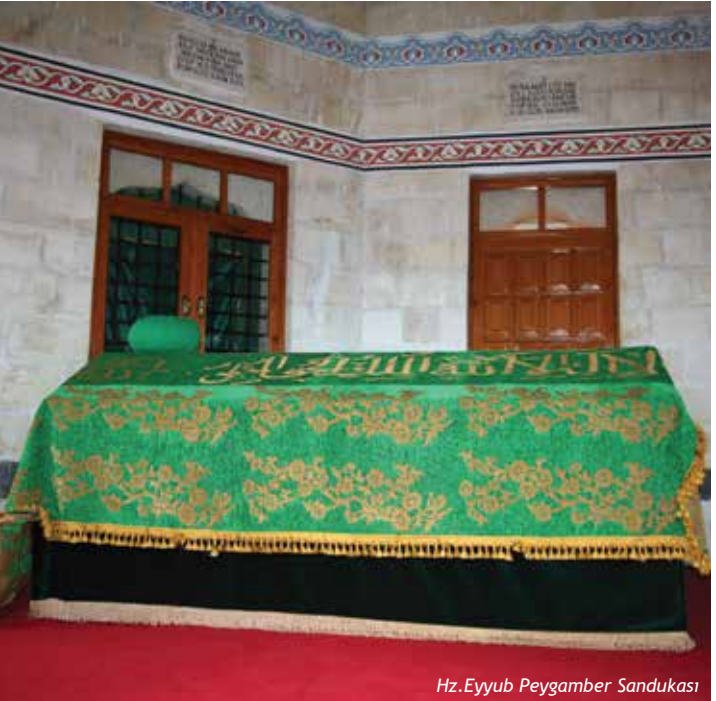
Hz.Eyyub Peygamber Sandukası

sahibi olmuştur. İmtihan öncesi sahip olduğu zenginliğe fazlasıyla sahip olmuştur. Hz. Eyyûb (a.s.)'un 93, bir başka görüşe göre 164 yaşında vefat ettiği rivayet edilir. Hz. Eyyûb (a.s.) Eyyüpnebi Beldesi'ne defnedilmiştir.