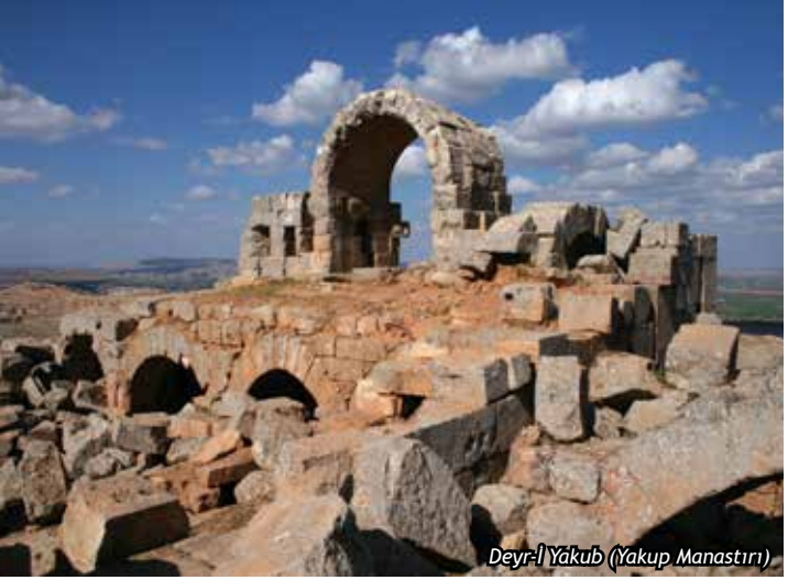
Deyr-i Yakub (Yakub Manastırı)

Deyr-i Yakub (Yakub Manastırı), merkeze 10 km. uzaklıkta, güneydeki dağların üzerinde yer alır. Halk arasında Hz. İbrahim Peygamber'in mücadele ettiği Kral Nemrud'un burayı seyfiye alanı olarak kullandığına inanılır. Bu bölgedeki yapı için, halk arasında “Nemrud'un Tahtı” ya da “Cin Değirmeni” ifadeleri kullanılır. Manastırın kuzeybatısında yer alan anıt mezarda bir kitabe yer alır. Bu kitabenin ilk satırı Grekçe (Eski Yunanca), ikincisi satırı Pamyra Süryanicesi ile yazılmıştır. Yazıt, muhtemelen 2. yüzyılın sonuna veya 3. yüzyılın başlarına aittir. Manastırın da bu tarihlerde yaptırıldığı tahmin edilmektedir.