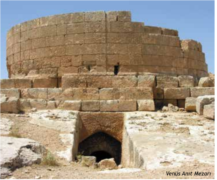
Venüs Anıt Mezarı

Soğmatar kült yeri, özellikle MS 165 yıllarında Partların (İranlılar) Urfa bölgesine yaptıkları yoğun saldırılardan dolayı bölgeden kaçan halk tarafından kurulmuş ve İslam dönemine kadar kült merkezi özelliğini korumuştur. Soğmatar'da, Şuayb Şehri gibi su ihtiyacını karşılamak için ana kayaya oyulmuş su kuyuları bulunmaktadır. Soğmatar Antik Şehri'ndeki tarihi kuyunun Hz. Musa Kuyusu olduğu rivayet edilir.