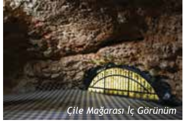
Çile Mağarası İç Görünüm